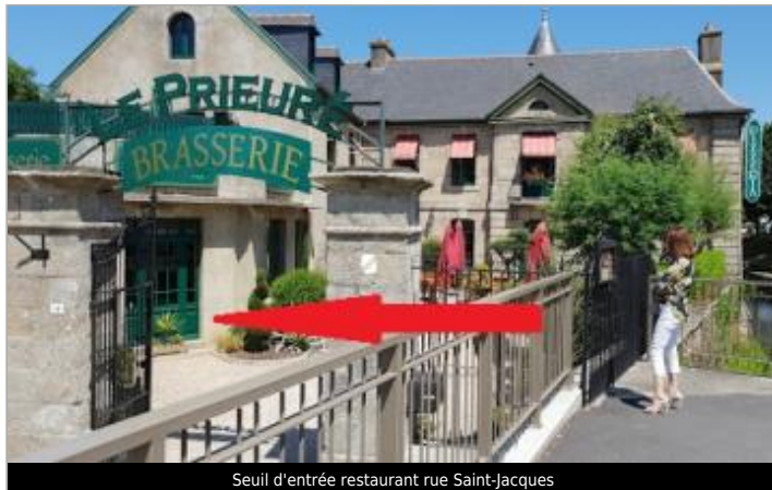
Seuil d'entrée restaurant rue Saint-Jacques

Coordonnées WGS84 : X: -2.51405095 / Y: 48.46813820