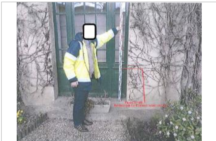
Seuil d'entrée restaurant rue Saint-Jacques