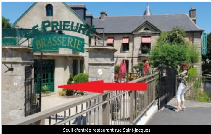
Seuil d'entrée restaurant rue Saint-Jacques