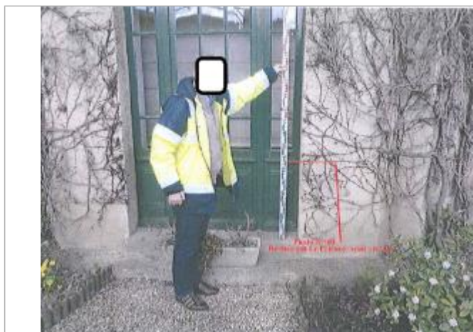
Seuil d'entrée restaurant rue Saint-Jacques

Différence entre le niveau d'eau et la référence (en m) : 0.700 m