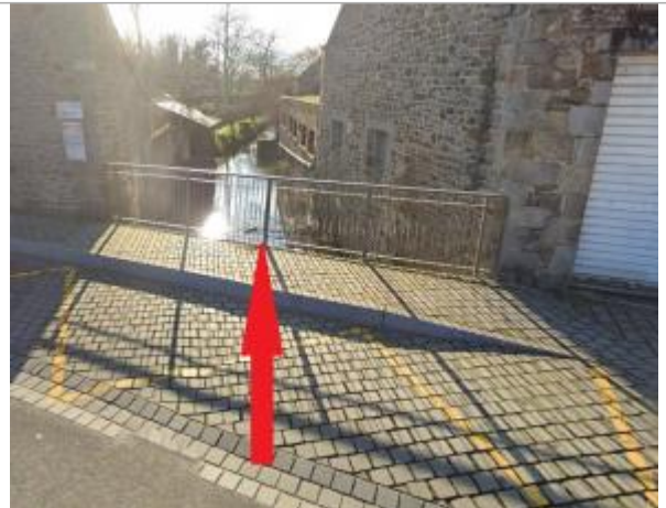
Pont sur le Guessant rue du général Leclerc

Coordonnées WGS84 : X: -2.51500785 / Y: 48.46829540