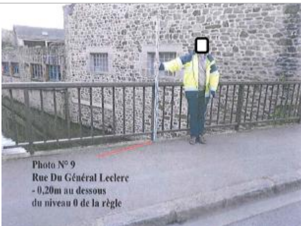
Photo N°9 Rue Du Général Leclerc - 0,20m au dessous du niveau 0 de la règle

Différence entre le niveau d'eau et la référence (en m) : -0.200 m