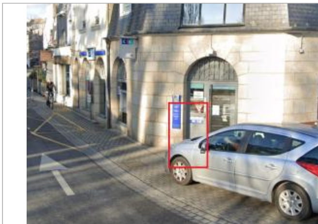
Seuil porte d'entrée agence bancaire