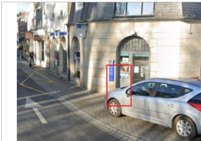
Seuil porte d'entrée agence bancaire