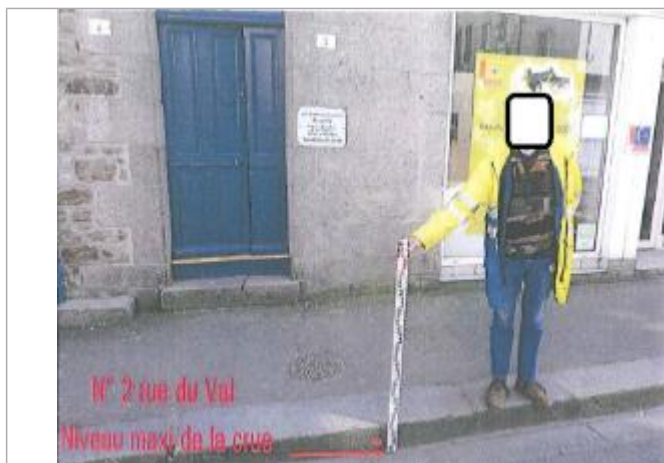
Limite de l'inondation sur la chaussée devant le n°2 rue du Val

Description référence du repère : Trottoir devant le n°2 rue du Val (ancienne chaussée en 2010)