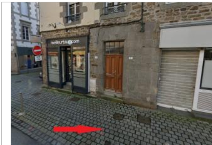
Trottoir devant le n°2 rue du Val

Coordonnées WGS84 : X: -2.51500202 / Y: 48.46880890