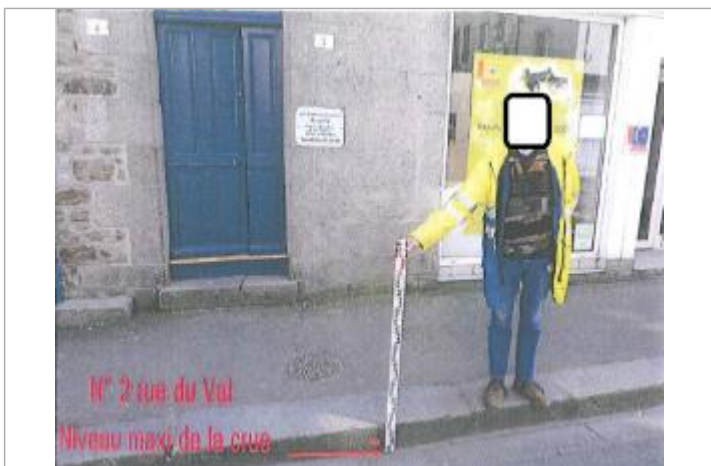
Limite de l'inondation sur la chaussée devant le n°2 rue du Val

MARQUE Maximum de l'inondation : Oui Visibilité : Non État du repère : Disparu Pérennité : Aucune