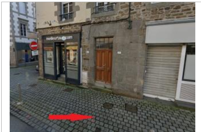
Trottoir devant le n°2 rue du Val

GÉOLOCALISATION Coordonnées WGS84 : X: -2.51500202 / Y: 48.46880890 Coordonnées RGF93 (Lambert 93) X: 292663.85 / Y: 6832957.68 Coordonnées RGF93 (ETRS89) : X: -2.515002 / Y: 48.4688089 Code Hydro: J13-0300 Rive de référence: Droite