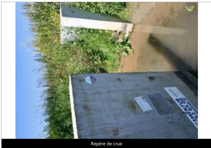
Repère de crue

MARQUE Texte : Niveau atteint par les eaux Méteren-Becque