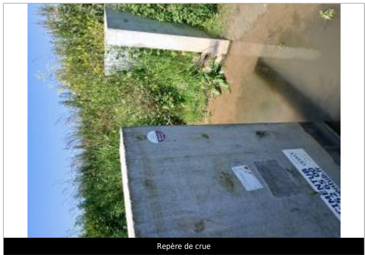
Repère de crue

MARQUE Texte : Niveau atteint par les eaux Méteren-Becque