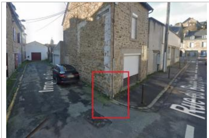
Angle de la rue et de l'impasse Bourg Hurel