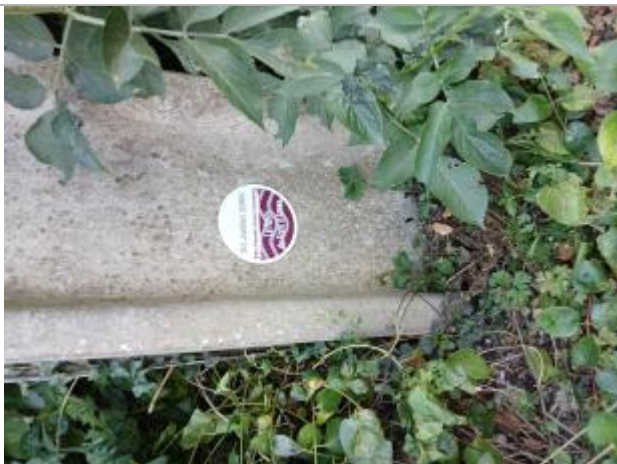
Le repère de crue