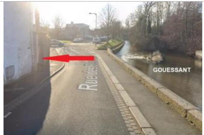
Pilier entrée au 7 rue des Boucouets (ancienne Charpentier)

Coordonnées WGS84 : X: -2.51199397 / Y: 48.46864900