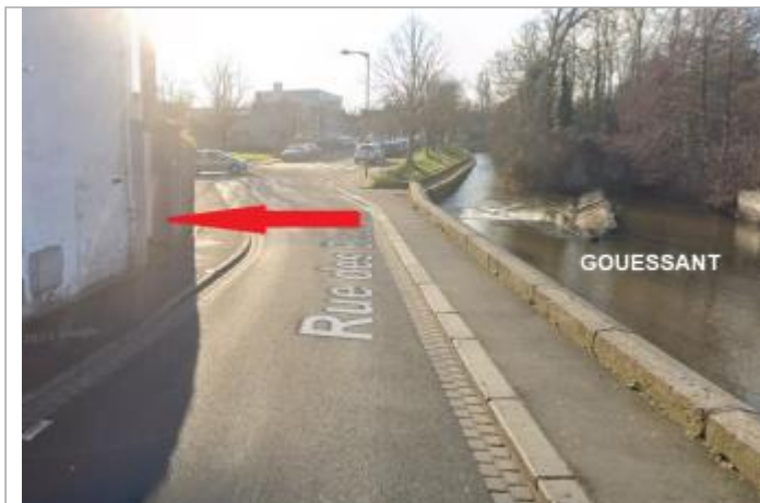
Pilier entrée au 7 rue des Boucouets (ancienne Charpentier)