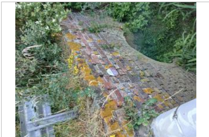
Le repère de crue