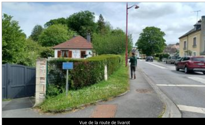
Vue de la route de livarot