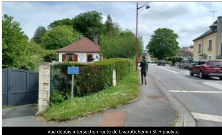
Vue depuis intersection route de Livarot/chemin St Hippolyte