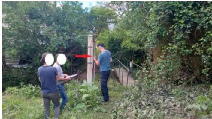
Vue depuis le sentier