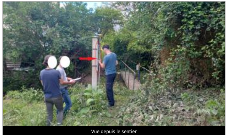
Vue depuis le sentier

Coordonnées WGS84 : X: 0.21189208 / Y: 49.10769110