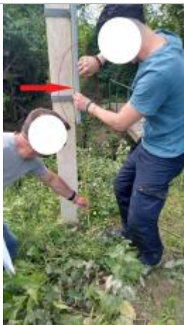
Laisse de crue à 118 cm/sol.

Altitude calculée de l'eau (en m) : 57.55 m