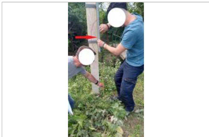
Laisse de crue à 118 cm/sol.

SOURCE DE REPÉRAGE : VISITE DE TERRAIN SPC SACN - 11/03/2020