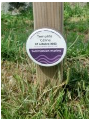
Submersion marine lors de la tempête Céline du 28 octobre 2023