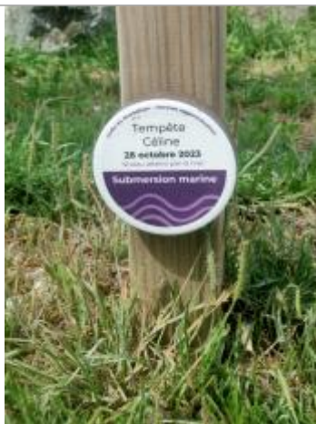
Submersion marine lors de la tempête Céline du 28 octobre 2023

Altitude calculée de l'eau (en m) : 2.95