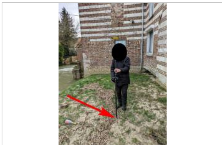
laisse au sol

Altitude calculée de l'eau (en m) : 25.854