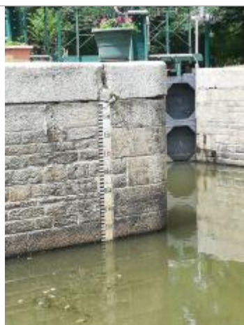
Echelle aval de l'écluse de la Maclais