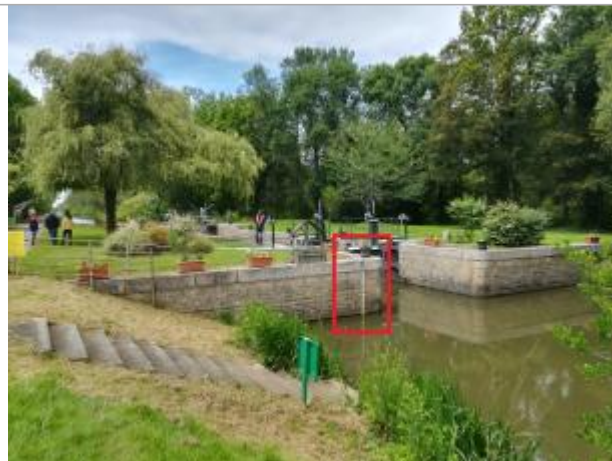
Ecluse de la Maclais aval

Coordonnées WGS84 : X: -2.12570838 / Y: 47.71393580