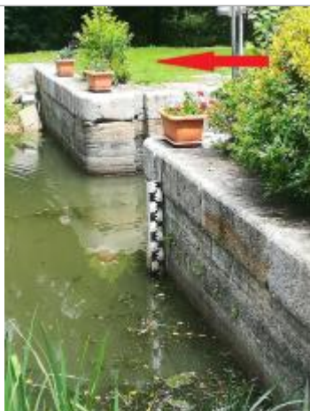
Echelle amont de l'écluse de la Maclais

Description référence du repère : zéro de l'échelle limnimétrique