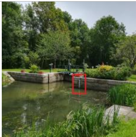
Ecluse de la Maclais amont