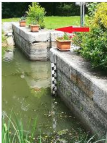
Echelle amont de l'écluse de la Maclais

Description référence du repère : zéro de l'échelle limnimétrique