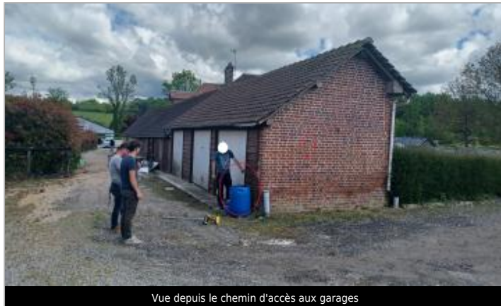
Vue depuis le chemin d'accès aux garages