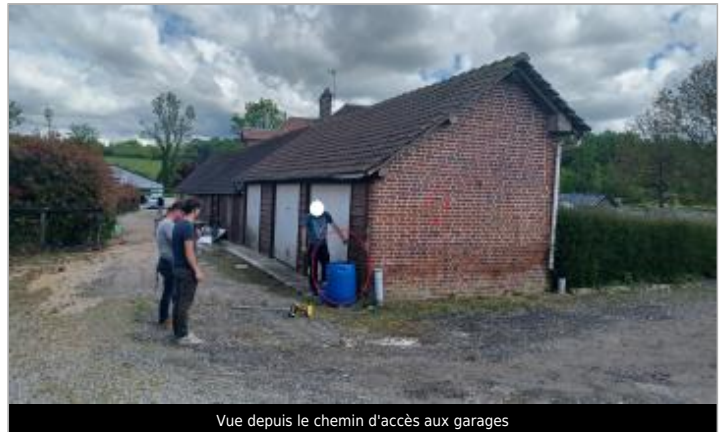
Vue depuis le chemin d'accès aux garages