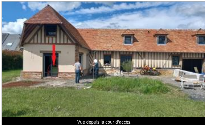
Vue depuis la cour d'accès.