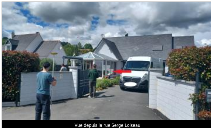
Vue depuis la rue Serge Loiseau