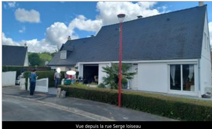
Vue depuis la rue Serge Loiseau