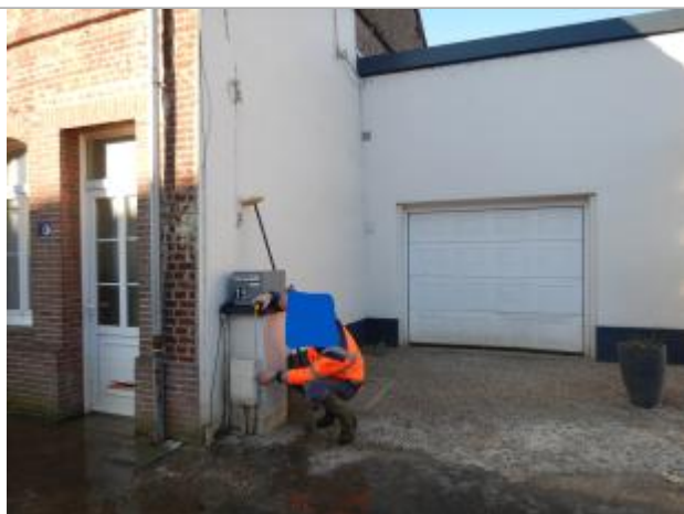
Repère sur le coffret électrique