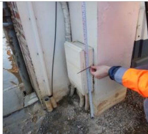
Le site du repère est un coffret électrique.