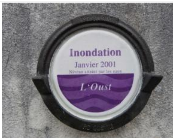
Repère normalisé de la crue de janvier 2001

Altitude calculée de l'eau (en m) : 25.02 m