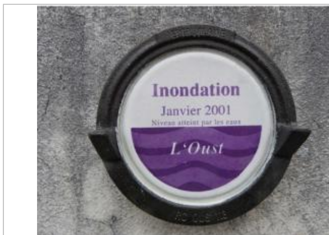
Repère normalisé de la crue de janvier 2001

Altitude calculée de l'eau (en m) : 25.02