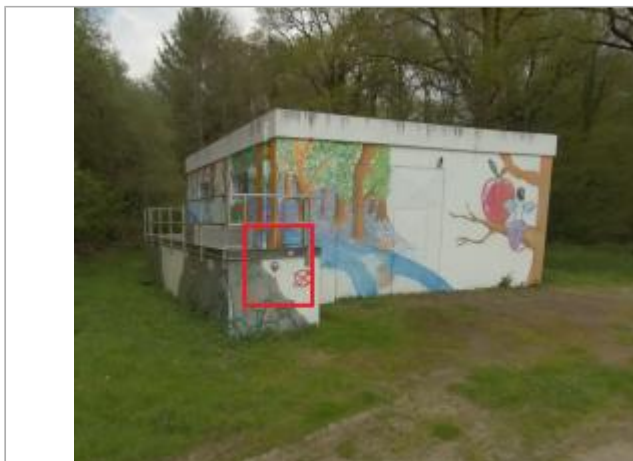
l'Herbinaye - Station AEP

Coordonnées WGS84 : X: -2.45936064 / Y: 47.90037900