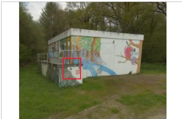
l'Herbinaye - Station AEP