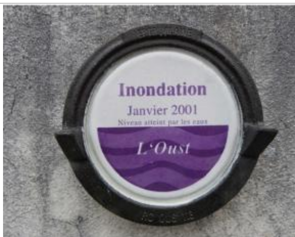
Repère normalisé de la crue de janvier 2001

Texte : Inondation Janvier 2001 - Niveau atteint par les eaux - L'Oust