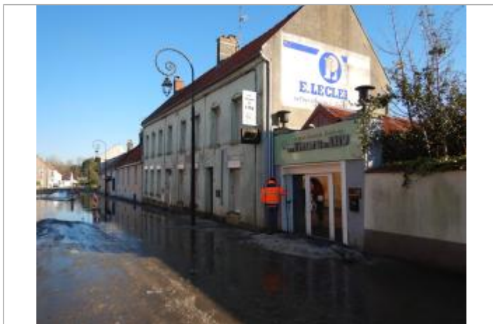
Site du repère