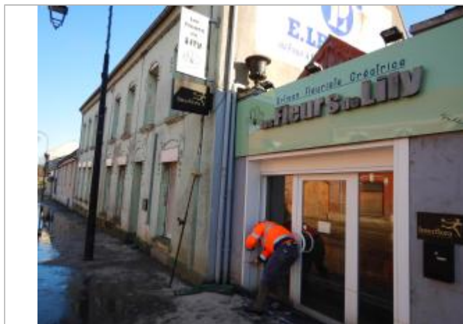
Repère du site

NIVELLEMENT RÉALISÉ PAR LE SYMCÉA. LE SYMCÉA N'EST PAS EXPERT GÉOMÈTRE. - 11/01/2024