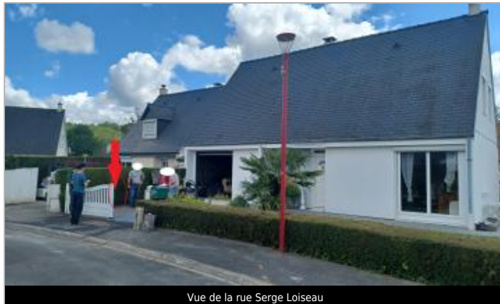
Vue de la rue Serge Loiseau