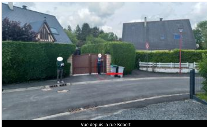
Vue depuis la rue Robert