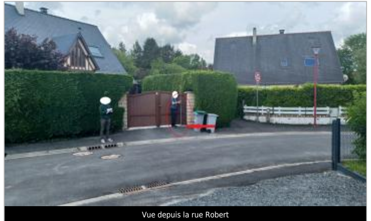
Vue depuis la rue Robert