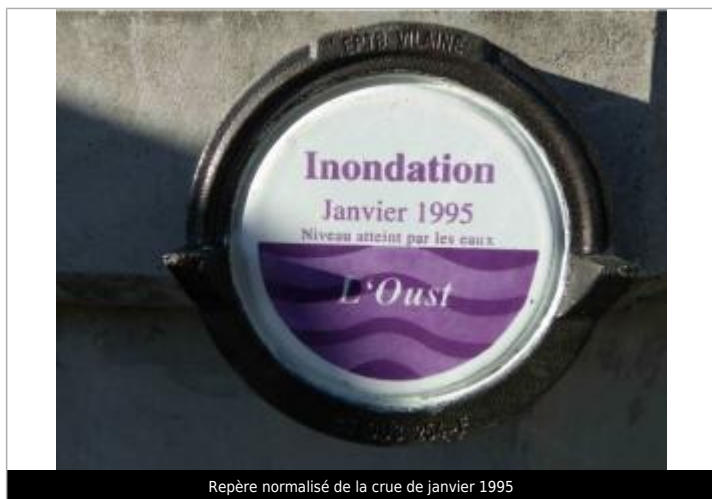
Repère normalisé de la crue de janvier 1995