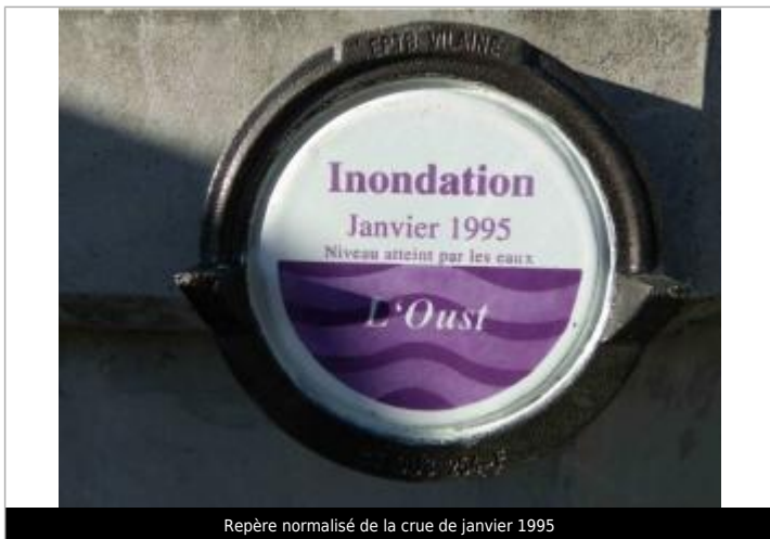
Repère normalisé de la crue de janvier 1995

Altitude calculée de l'eau (en m) : 5.49