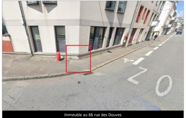
Immeuble au 66 rue des Doves

Coordonnées WGS84 : X: -2.08671278 / Y: 47.64924900