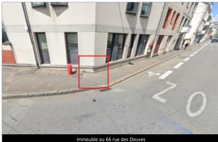
Immeuble au 66 rue des Douves