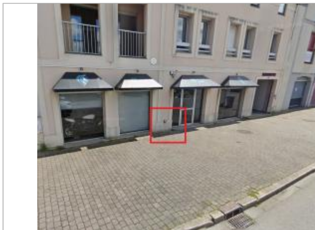
Immeuble au 8 rue du capitaine Martin