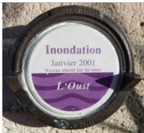
Repère normalisé de la crue de janvier 1995

Altitude calculée de l'eau (en m) : 5.49 m