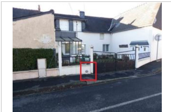
Maison au 18 rue Jacques Cartier