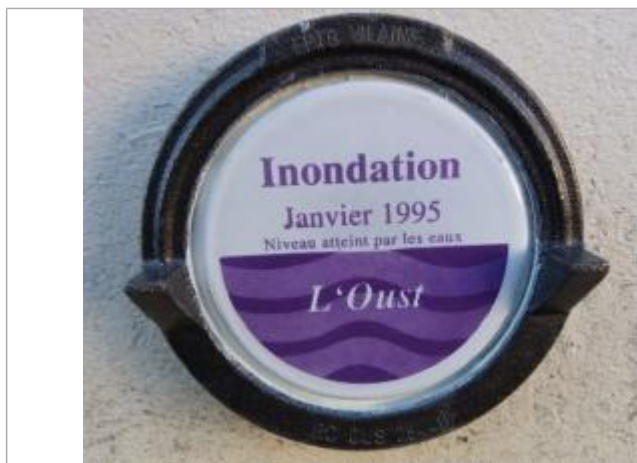
Repère normalisé de la crue de janvier 1995

Altitude calculée de l'eau (en m) : 5.33