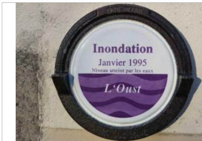
Repère normalisé de la crue de janvier 1995

Altitude calculée de l'eau (en m) : 5.42 m