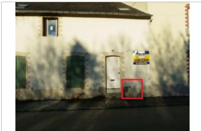
Maison au 22 rue des Noés avec le repère en 2010