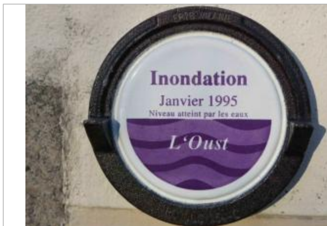
Repère normalisé de la crue de janvier 1995

Altitude calculée de l'eau (en m) : 5.42