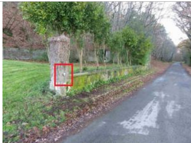
Poteau en 2010 avec repère

Coordonnées WGS84 : X: -2.05028931 / Y: 47.66157440