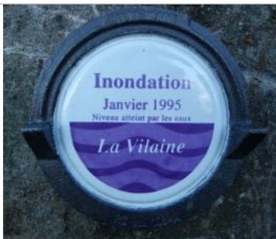
Repère normalisé de la crue de janvier 1995

Texte : Inondation Janvier 1995 - Niveau atteint par les eaux - La Vilaine