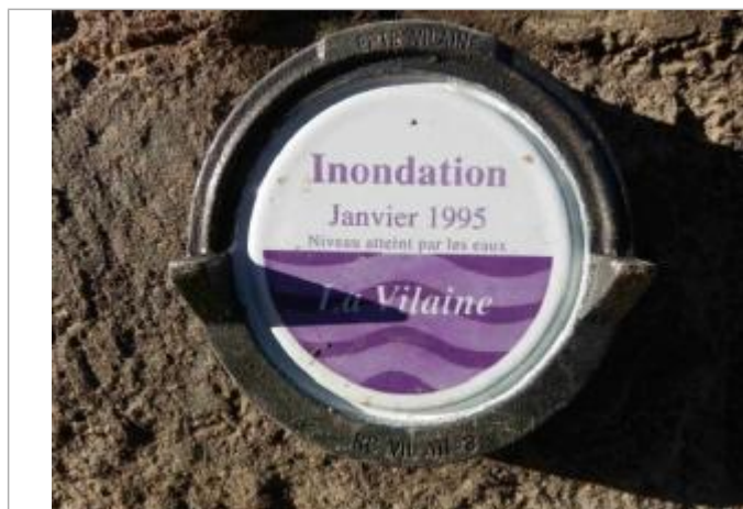
Repère normalisé de la crue de janvier 1995

Altitude calculée de l'eau (en m) : 5.65