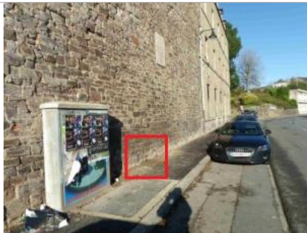
site du repère en 2010