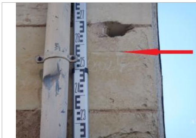
Vue du repère - Auteur : SPC LACI