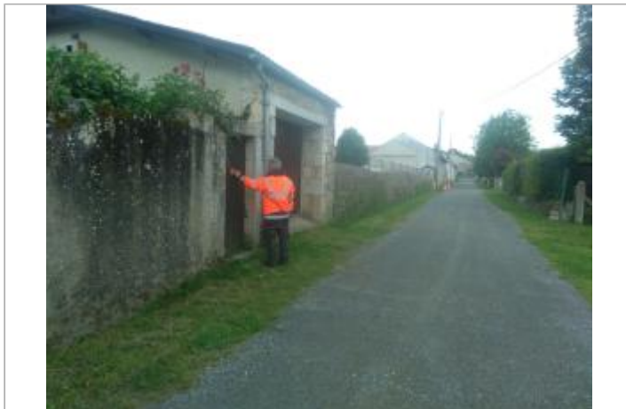
Vue du site - Auteur : SPC LACI