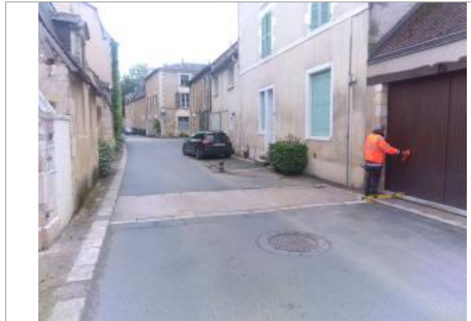
Vue du site - Auteur : SPC LACI

Coordonnées WGS84 : X: 0.87097080 / Y: 46.56541520