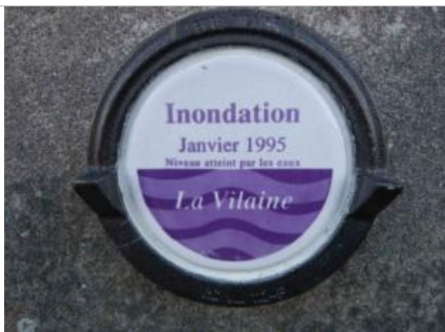
Repère normalisé de la crue de janvier 1995

Altitude calculée de l'eau (en m) : 5.17 m