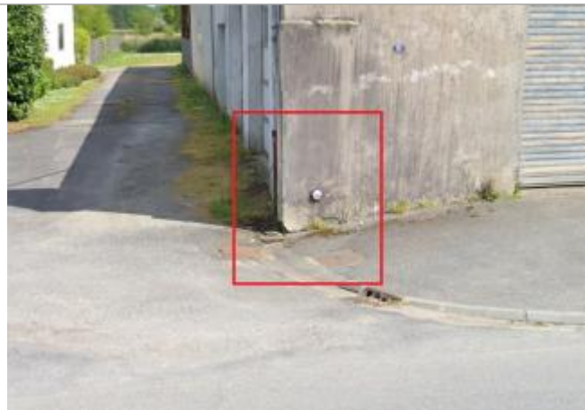
Entreprise au 51 rue de Vannes