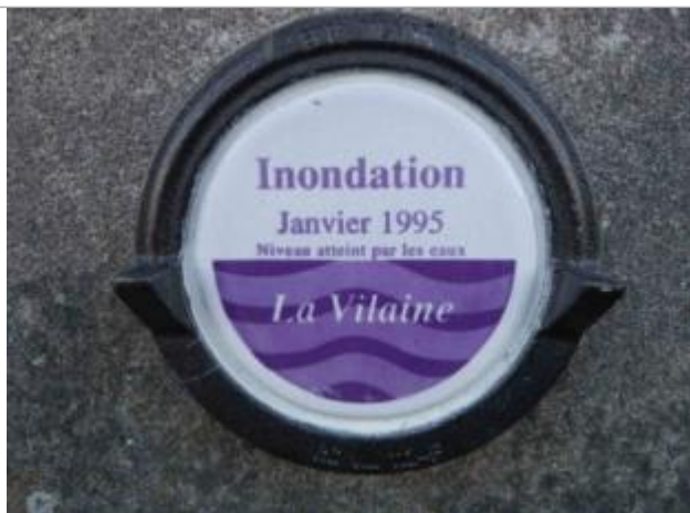
Repère normalisé de la crue de janvier 1995

Altitude calculée de l'eau (en m) : 5.17