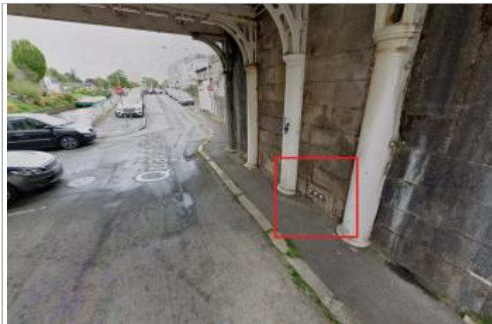
Quai de Brest sous le pont de la grande rue