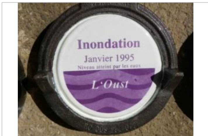
Repère normalisé de la crue de janvier 1995

Altitude calculée de l'eau (en m) : 5.62 m