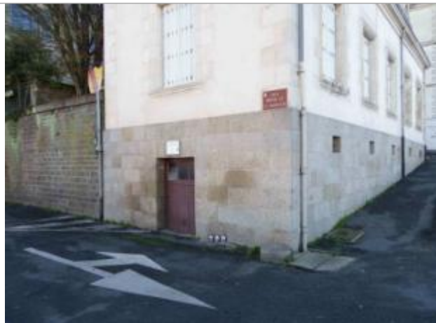
Ancienne maison éclusière 2 quai Amiral de la Grandière