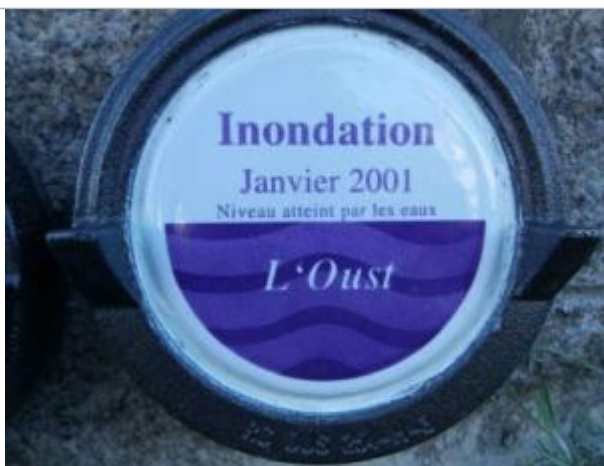
Repère normalisé de la crue de janvier 2001

Altitude calculée de l'eau (en m) : 5.62 m