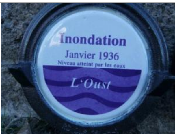
Repère normalisé de la crue de janvier 1936

Altitude calculée de l'eau (en m) : 5.6 m