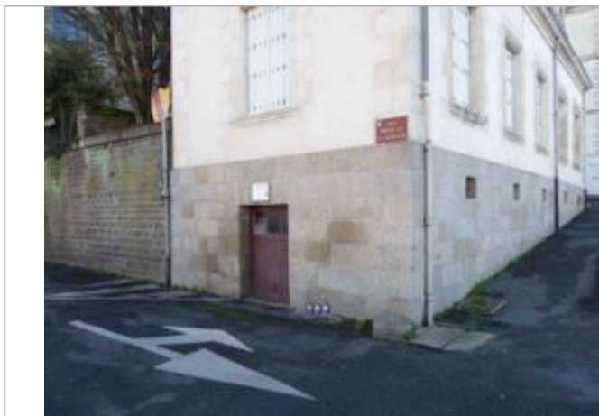
Ancienne maison éclusière 2 quai Amiral de la Grandière

Coordonnées WGS84 : X: -2.08637166 / Y: 47.64844950