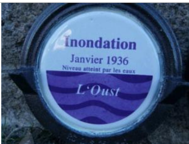
Repère normalisé de la crue de janvier 1936

Altitude calculée de l'eau (en m) : 5.6 m