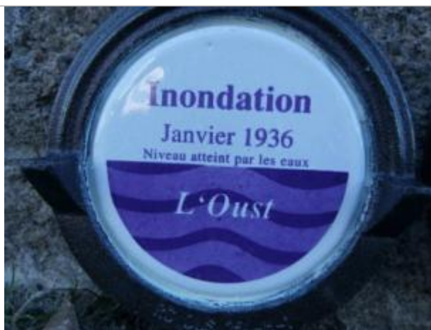
Repère normalisé de la crue de janvier 1936

Altitude calculée de l'eau (en m) : 5.6 m