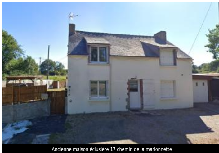
Ancienne maison éclésièr 17 chemin de la marionnette