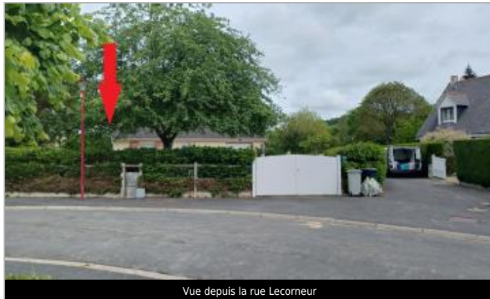
Vue depuis la rue Lecorneur

Coordonnées WGS84 : X: 0.21399006 / Y: 49.11030900