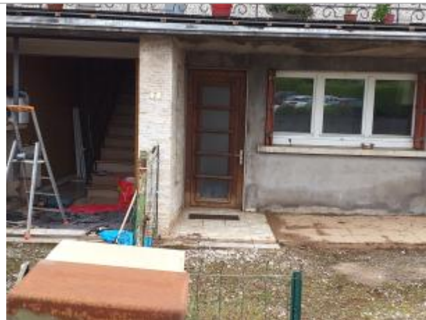
7 rue du Bas du Village - Saulnot