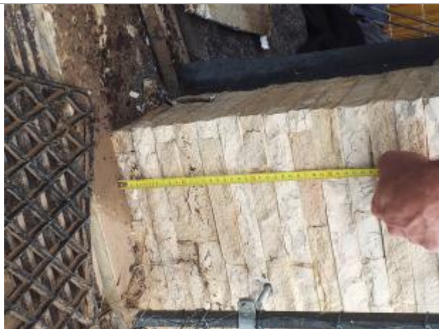
11 cm par rapport au seuil de la porte de garage