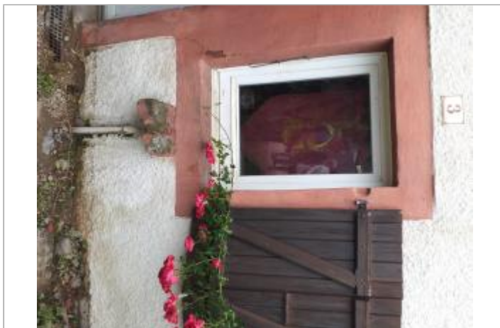
3 rue du Bas du Village - Saulnot