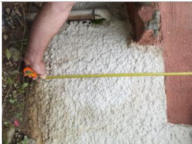
69 cm à partir de la tablette de fenêtre