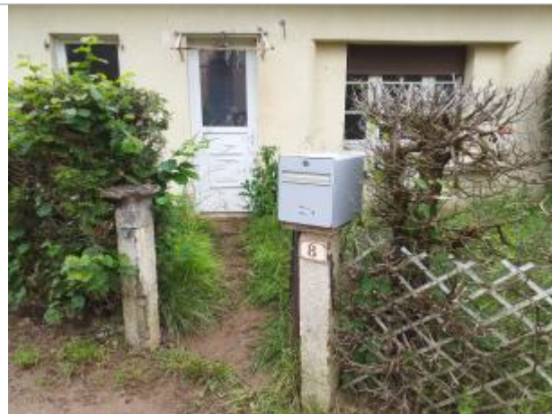
8 rue de Malval - Saulnot