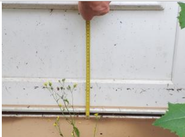
11 cm par rapport au seuil de la porte