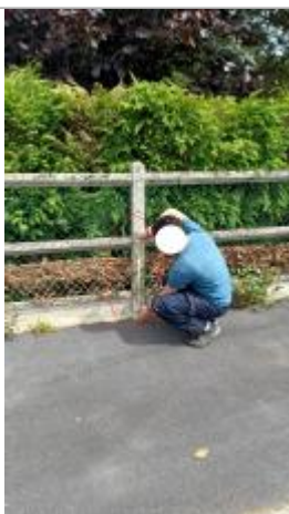
Laisse de crue à 58 cm/sol.

Altitude calculée de l'eau (en m) : 55.81