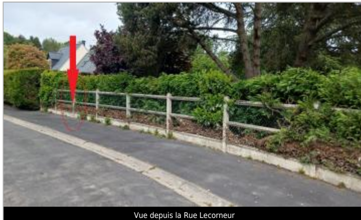
Vue depuis la Rue Lecorneur